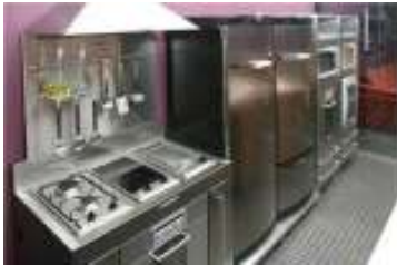
Tapa de cocinas