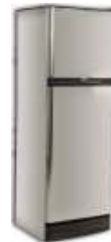
Revestimiento de heladeras